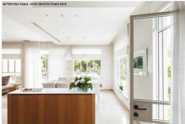
מית האוכל והיציאה לגינה. בשבב המימיליוס