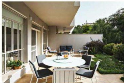
האי במבט נמתח לאורך של יותר משלושה מטרים