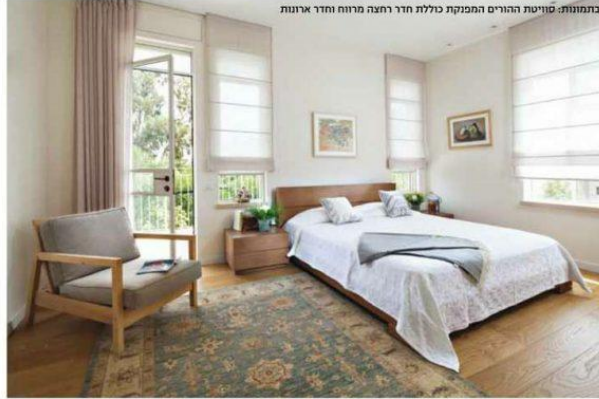
בתמונות: סוויטת הווים המפיקת כללת חדר רחצה מרווח וחדר ארונות